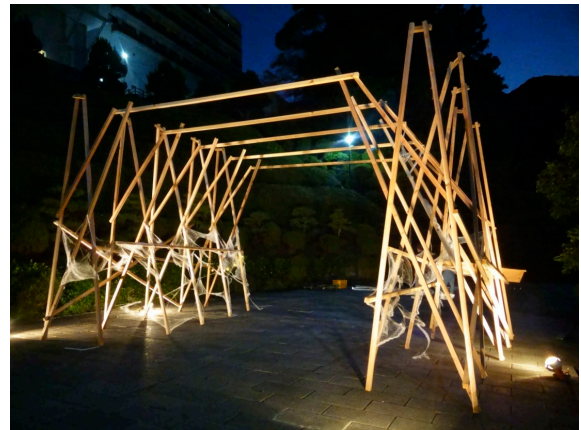
造大祭夜のライトアップ