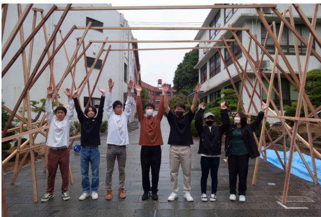
組立て完了の喜び