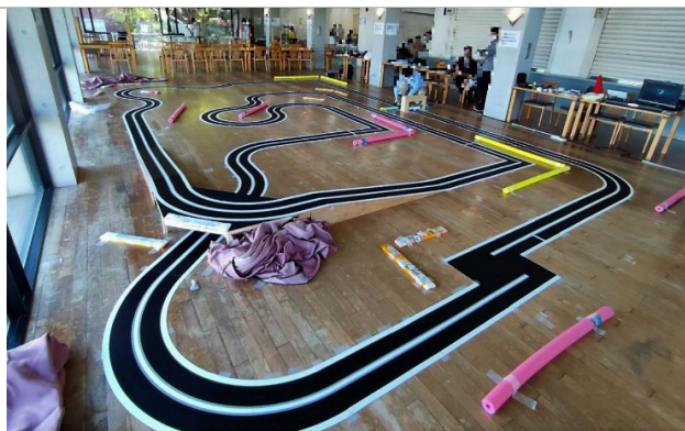
造大祭での記録会のコース