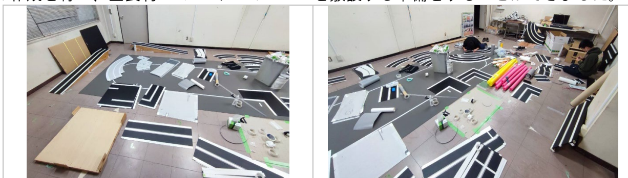
コース作成の様子

昨年度に引き続き、マイコンカー競技に向けた環境構築を行いました。本年度はコースの作成を行い、全長約 50 メートルのコースを敷設する準備をすることができました。