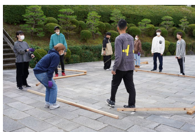
木製オブジェの作成