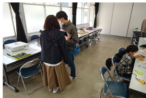
増大祭での建築模型展