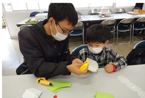
造大祭での模型体験