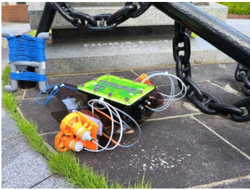
作成した水中ロボット

水中ロボコン in JAMSTEC のフリー部門に、 2倍強の応募の中での書類審査による大会へ出場 。大会では、ポスターセッションでの発表と、水槽演技を行いました。来年度は課題のAUV化を行います。