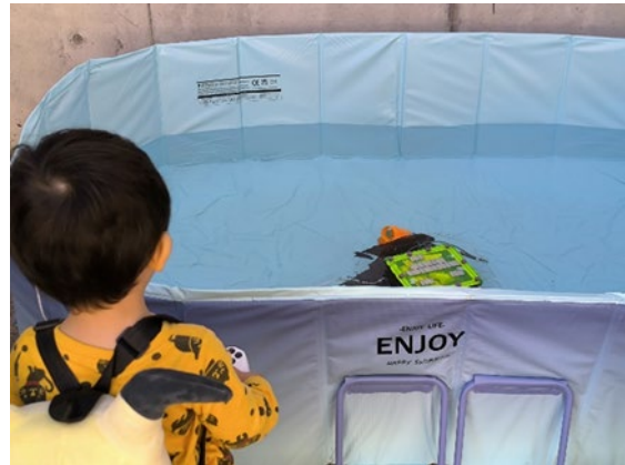
造大祭での操作体験イベント