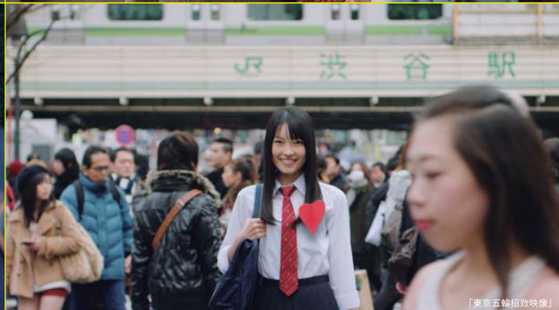
「東京五輪招致映像」