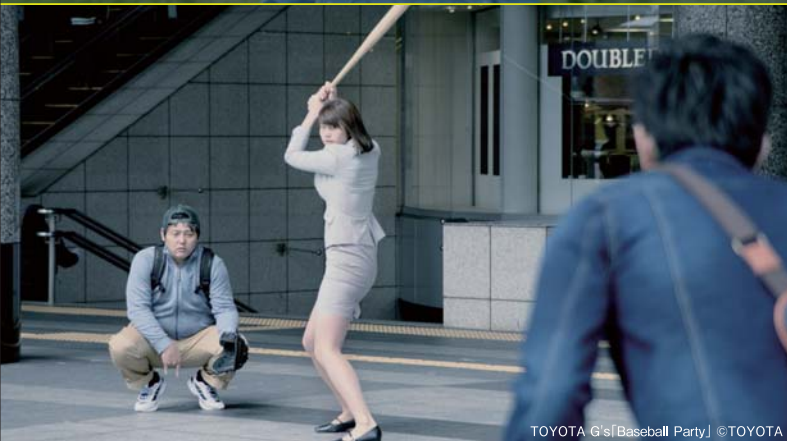
TOYOTA G's「Baseball Party」