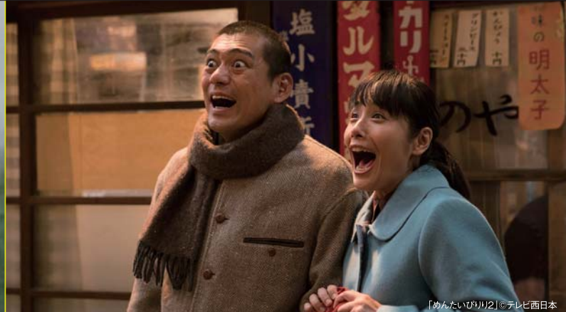
「めんたいのり2」